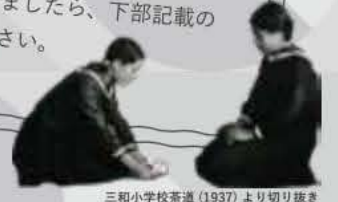
三和小学校茶室 (1937) より切り抜き

「年代に関わらず捨てようか迷っている写真がある」「写真はないけど思い出を話したいから聞き取りをしてほしい」などなどございましたら、下部記載の問い合わせ先までご相談ください。