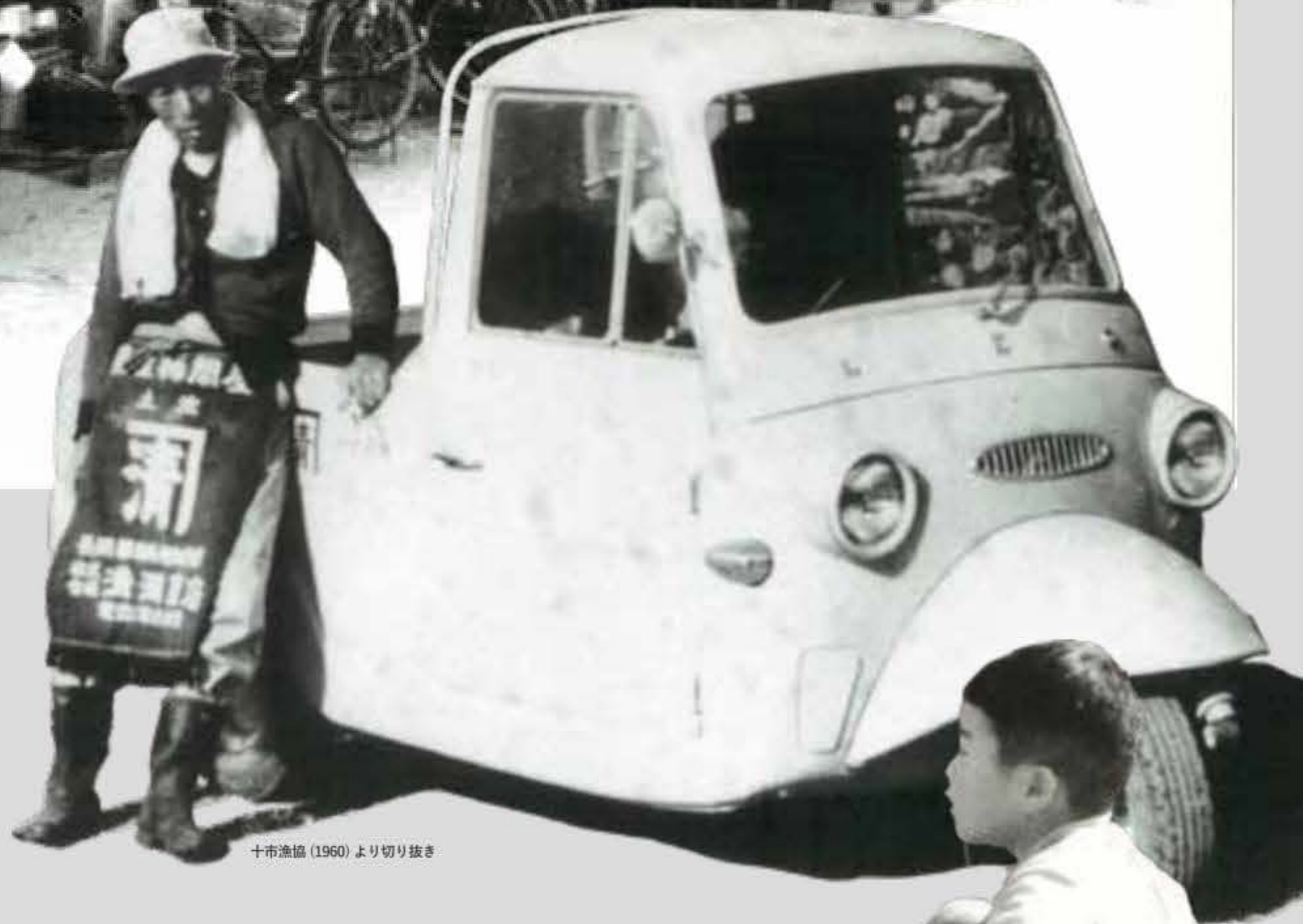
十市漁協 (1960) より切り抜き