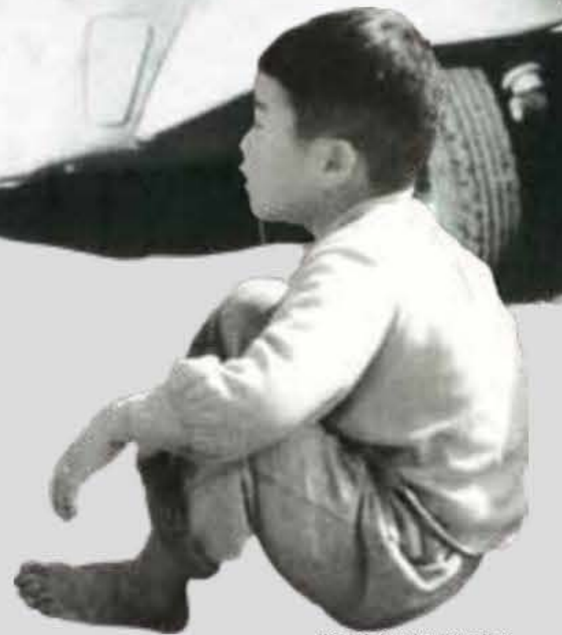
前浜海岸 (1955) より切り抜き