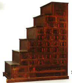
1.吉村大我「花台図」(部分) 2.結納の松・竹・梅 3.松負天神(三次人形) 4.四十九日の餅(三原村) 5.盃台 6.島内松南「軒端の梅」 7.下司凍月「寒牡丹」 8.血鉢 9.花(日高村小村神社) 10.丸に桔梗紋柄鏡 11.壺 12.ティーポット 13.葬式の花(土佐清水市松尾) 14.階段タンス 15.花台(佐川町瑞応)