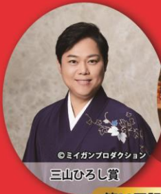
◎マイガンプロダクション 三山ひろし賞