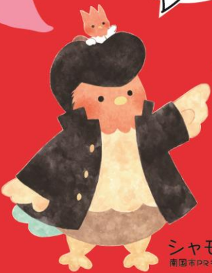
シャモ番長 南国市PRキャラクター